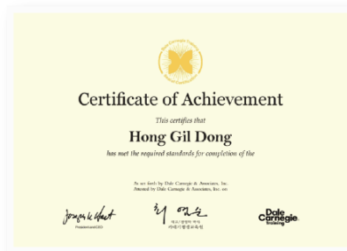
<美데일카네기 본사 인증 수료증>

전 세계 90개국에서 동일하게 인정받는 美 데일카네기 본사가 인증한 수료증을 수여합니다.