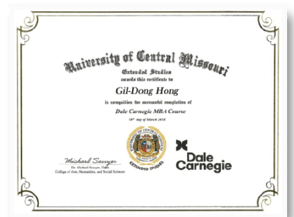
<美미주리대학 MBA코스 수료증>

전국 30,000명의 회원들이 한국카네기클럽의 정회원으로 활동하고 있으며, 조찬포럼, 트레킹, 골프, 문화활동, 이슈 및 세미나 등 다양한 활동을 진행하고 있습니다.