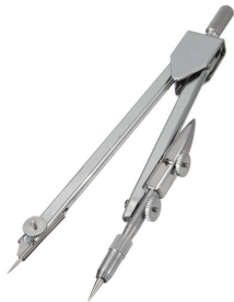
시각디자인의 눈과 산업디자인의 컴퍼스